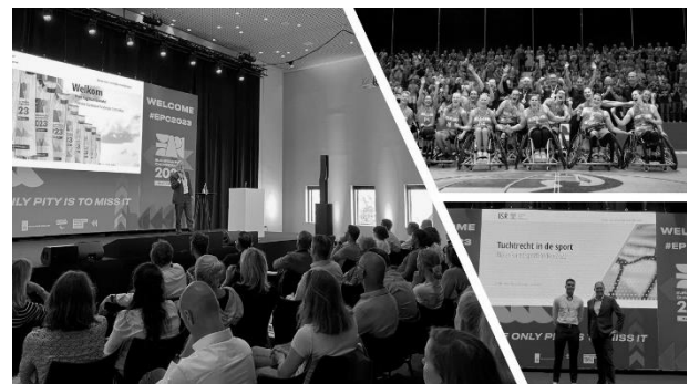
Foto: Bondenbijeenkomst ISR tijdens de Europese Parasportkampioenschappen in Ahoy in aug 2023.

Met aangesloten sportbonden vindt er eveneens kennisdeling plaats tijdens de jaarlijkse bondenbijeenkomst. Dit jaar vond de bijeenkomst plaats op 28 augustus waarbij het ISR aansloot bij de Europese Parasportkampioenschappen, een multi-sportevenement waar 1.500 atleten met een beperking in Ahoy Rotterdam streden om Europese titels. Tijdens de bondenbijeenkomst zijn diverse thema's aan bod gekomen, waaronder de ontwikkelingen binnen het ISR, de reglementen en het toepassen van de ordemaatregel door bonden.