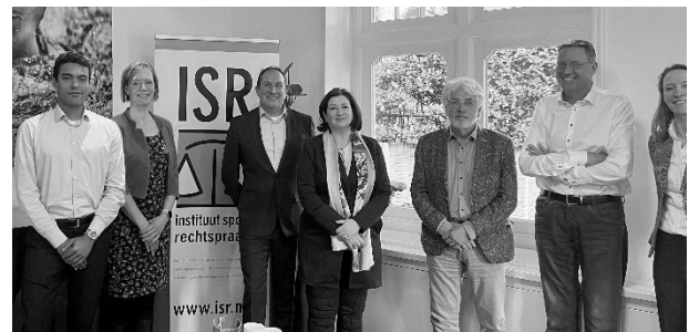
Foto: Minister Conny Helder met een afvaardiging van het ISR tijdens haar werkbezoek in maart 2023.

Kort na publicatie van het rapport, op 30 maart 2023, bracht minister voor Langdurige Zorg en Sport, Conny Helder, een werkbezoek aan het ISR in Hilversum. Tijdens het anderhalf uur durende werkbezoek was van de zijde van het ISR een vertegenwoordiging van de werkorganisatie en het bestuur aanwezig, alsook een vertegenwoordiging van de aanklagers en onderzoekers van het ISR.