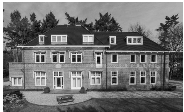
Het ISR is gevestigd in 'Landhuis 't Holtink' aan de Utrechtseweg in Hilversum.

In 2021 heeft het ISR stappen gezet om te verzelfstandigen en als onafhankelijke stichting haar eigen medewerkers in dienst te nemen en de werkorganisatie in te richten. Per 1 januari 2022 is de organisatie volledig verzelfstandigd en sterk gegroeid in het aantal bureaumedewerkers. Per januari 2022 is het ISR gevestigd aan de Utrechtseweg in Hilversum waar het de benedenverdieping van een (gedeeld) kantoorpand betreft.