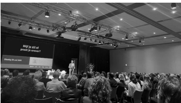
Foto: Congres "Blijf je stil of praat je erover" op Papendal in mei 2023.

Het ISR deelt haar kennis van het tuchtrect op relevante congressen en bijeenkomsten. Een daarvan is het congres 'Blijf je stil of praat je erover' van het CVSN dat op 23 mei 2023 plaatsvond in Hotel en Congrescentrum Papendal. Het ISR was met een stand aanwezig om vragen van bezoekers te beantwoorden en heeft een interactieve sessie verzorgd over de procedures binnen het tuchtrect in de sport.